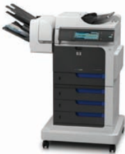
MFP HP ColorJet Enterprise CM4540fsm