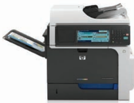
MFP HP ColorJet Enterprise CM4540