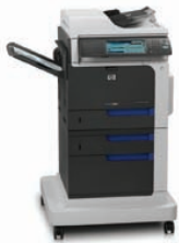
MFP HP ColorJet Enterprise CM4540f